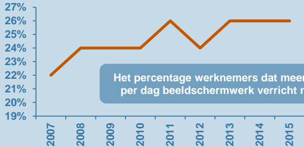
>6 uur per dag beeldschermwerk 4

Het percentage werknemers dat meer dan 6 uur per dag beeldschermwerk verricht neemt toe